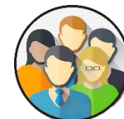
Родитель (законный представитель)