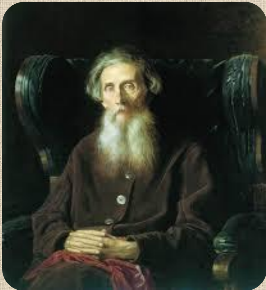
Владимир Иванович Даль

«Мы уверены, что русской речи предстоит одно из двух: либо испошлить донельзя, либо, образумясь, свернуть на иной путь, захватив притом с собою все покинутые второпях запасы»