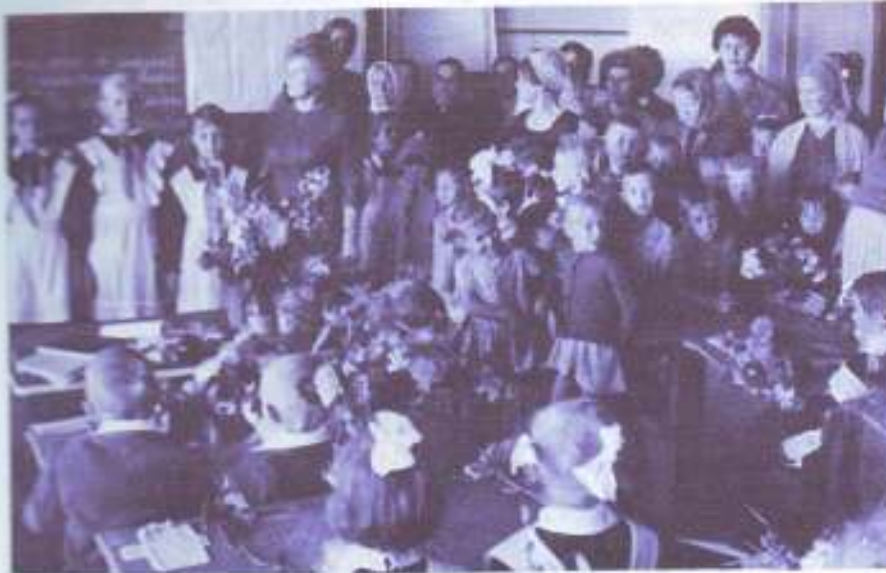
В первый класс! Век 20-й!