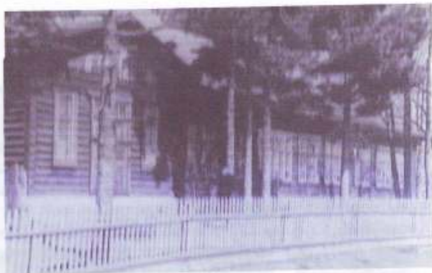
Вид школы со стороны пришкольного участка.