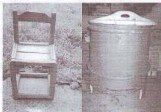
Виды старинной мебели: Стул и таз.

Мебель тоже делалась своими руками. Красивые резные буфеты, столы, стулья. Ими пользовалось не одно поколение. У некоторых жителей Лая эта