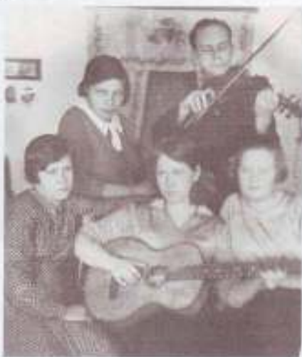
Три сестры в гостях у брата.

Дом был веселым и светлым, музыка в нем жила,