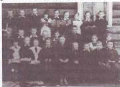
1956 год