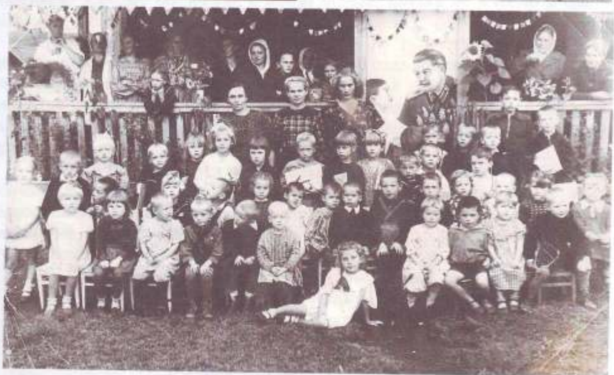
Группы сельсоветского детского сада на улице Ленина. 1950, 1952, 1953 годы.

Второе – детский сад для детей работников совхоза. Совхозный детский сад № 1 относился к отделу учебных заведений Свердловской железной дороги, поскольку и все сельское хозяйство Лаете тех времен считалось подсобным предприятием железной дороги. Располагался детский сад в двух зданиях: