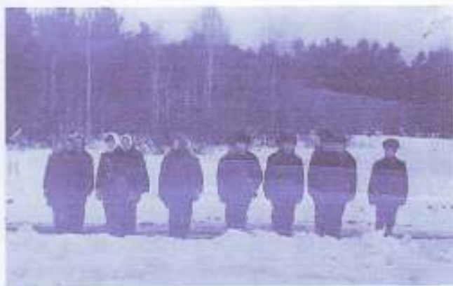
Игра «Зарница». 1972 год. Бравые воины.