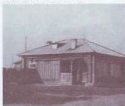
Церковно - приходская школа, 1961 год

В 1870 году в результате реформ царя Александра II активизировалась деятельность земских управленческих органов местного самоуправления. По ходатайству жителей села Земство открыло школу для детей местного населения, построив здание с тремя классными комнатами. Кроме классных комнат была учительская и помещение, где при школе жила техничка с семьей.