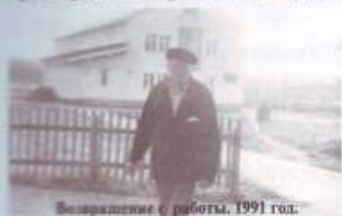
На заднем плане первое здание СПТУ № 34.

Профессионально-техническое училище № 34 основано в 1986 году приказом № 34 от 18. 02. 1986 года Госкомитета РСФСР по профтехобразованию и приказом № 102 от 21. 03. 1986 года Свердловского областного управления по профтехобразованию в селе Большая Лая Пригородного района Свердловской области по улице Зеленая площадь, 11.