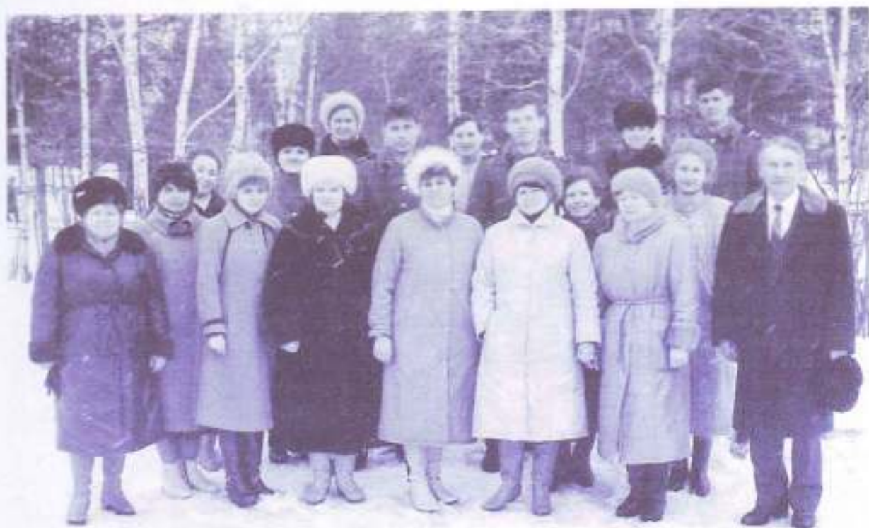
5 апреля 1990 года. Педагоги – участники районного смотра художественной самодеятельности.

Педагоги ежегодно участвуют в учительских смотрах, выступают с праздничными концертами перед жителями села.