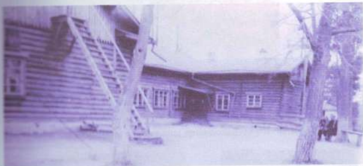
Лайская средняя школа № 4, вид со двора. Виден центральный вход для учащихся. Под лестницей окно учительской, здесь же был и вход для учителей.