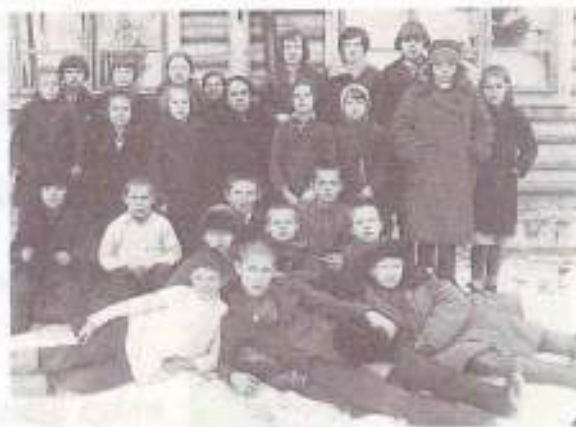
Учащиеся школы: 1935 и 1939 годы.