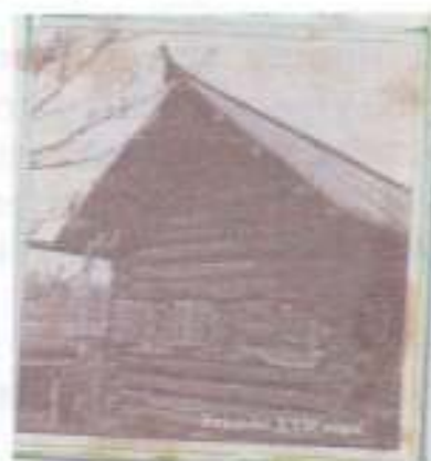
Усадьба 17 века.