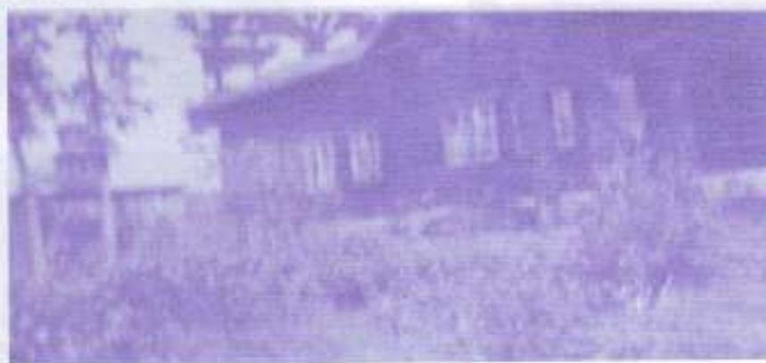
Филиал №2 Лайской школы.