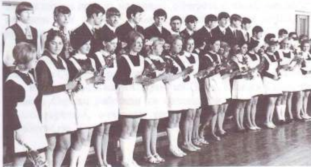
Последний звонок. 25 мая 1974 года.