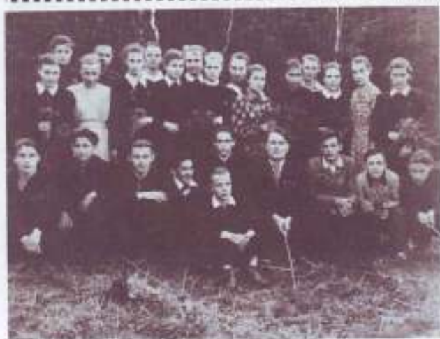
Первый выпуск 10 класса (1957 год). Поход в лес в День последнего звонка.