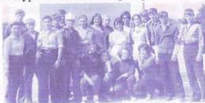
9 класс 1973 год, поездка на НТМК.

ученики знали предмет, были успешными. Для этого проводились различные экскурсии на главные предприятия Нижнего Тагила