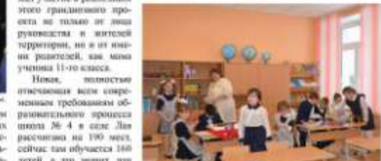
Новый конструктор - большое количество современных учебных пособий.