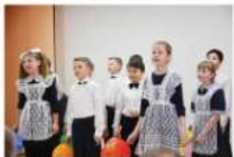
Приветствие гостей мероприятия учащиеся школы.