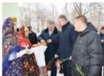
Поздравляя гостей мероприятия на русском языке, приветствуют на английском.