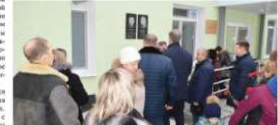
Приветствие гостей мероприятия, они из кабинета директора школы.

каждой, как основу всему в развитии школьного образования во всем Горноуральском городском округе.