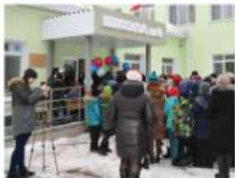
Школа впервые после ремонта распустила свои бутоны.