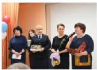
В завершение дня гости принимают благодарности и подарки.

Одессичане. Начало на 1 стр. Здание школы №4 в селе Лав было построено в 1961 году и с этого момента капитальный ремонт в ней не разу не проводился. В августе 2018 года по результатам экспертизы здание было признано аварийным и опасным для эксплуатации, а значит в школе пришлось приостановить. Учителями и учащимися на время пришлось выехать в школу №24 в поселке Горноуральский, где был организован учебный процесс во вторую смену. Реализация одного из крупнейших за последние годы проектов в социальной сфере Горноуральского городского округа стала возможна в первую очередь благодаря успешному взаимодействию в Свердловской области федеральной программой «Самые лучшие школы» и субъектах Российской Федерации (исходя из приоритетной потребности новых мест в общеобразовательных организациях).